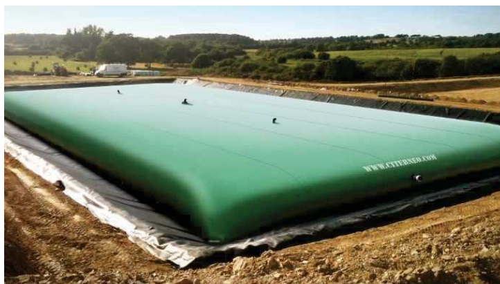
Poche de stockage avec merlon – image d’illustration